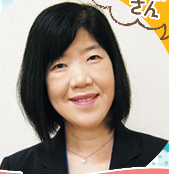
摂南大学管理栄養士