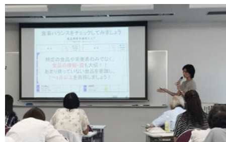
奈良県内における栄養講習の様子

【地域との連携】 栄養講習などを引き続き行うことで、高齢者の方の身体状況改善およびフレイルに関する啓蒙活動に取り組みたいと思います。