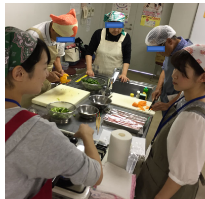
介護予防教室における調理実習